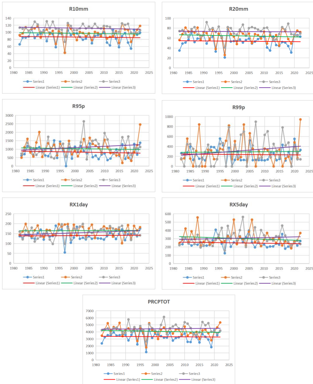
Gambar 1. Tren estimasi indeks curah hujan ekstrem selama 4 dekade. Series 1 mewakili SM Fatmawati Soekarno, Series 2 mewakili SM Minangkabau dan Series 3 Mewakili SM FL Tobing

Berdasarkan perkiraan tren untuk indeks curah hujan, dapat disimpulkan bahwa terdapat tren yang tidak signifikan karena adanya variasi pengukuran dan sifat parameter yang sangat tinggi secara spasial dan temporal. Terlebih lagi daerah tropis di mana sebagian besar curah hujan berasal dari konveksi dengan variabilitas spasial yang tinggi setiap harinya (Collischonn dkk., 2008; Prasetyo, 2021). Dari grafik diatas juga menunjukkan bahwa pada pesisir barat Pulau Sumatera memiliki curah hujan paling rendah terjadi ketika tahun 1997, hal ini serupa dengan penelitian yang dilakukan oleh